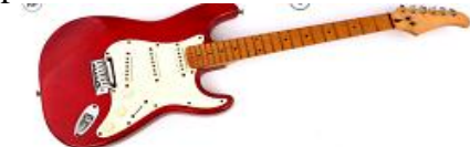
Gitara elektryczna, online (jhb), CC BY 3.0

Gitara elektryczna posiada struny metalowe, nie ma jednak pudła rezonansowego. Zasada działania opiera się na przetwornikach elektromagnetycznych, które wysyłają impuls do wzmacniacza gitarowego najczęściej zintegrowanego z głośnikiem, potocznie nazywanym piecem.